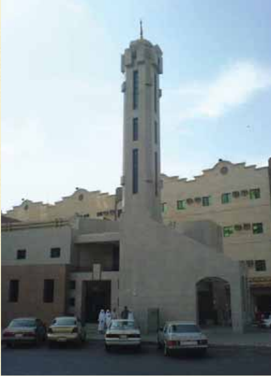
▲ Cin Mescidi