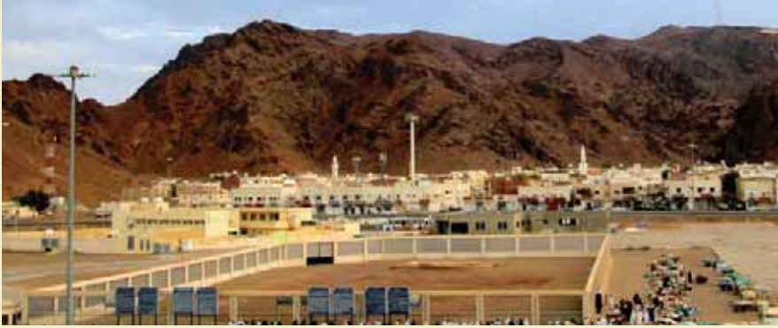
◀ Uhud Şehitliği