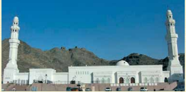
Yedi Mescitler (Hendek Camii) ▶