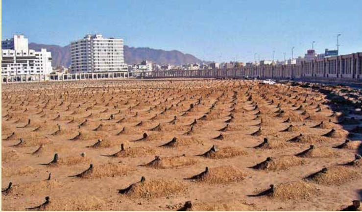
◀ Cennetü'l Baki Kabristanı