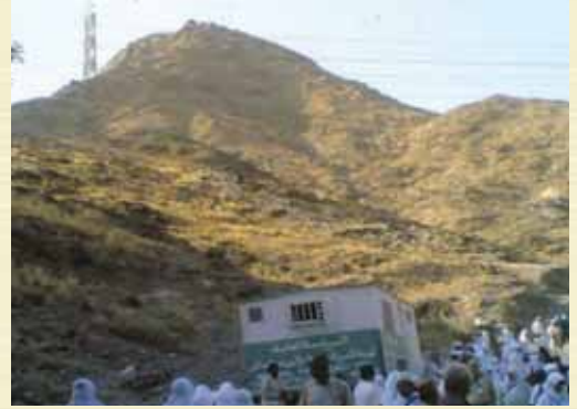
▲ Sevr Dağı