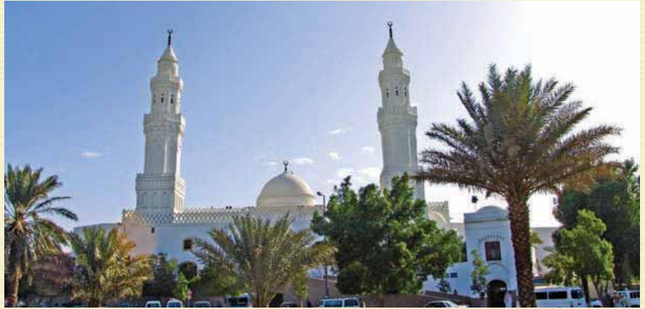
Kibleteyn Mescidi ▶