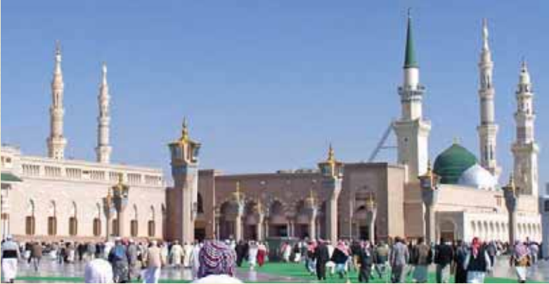
◀ Masjid-i Nebevi